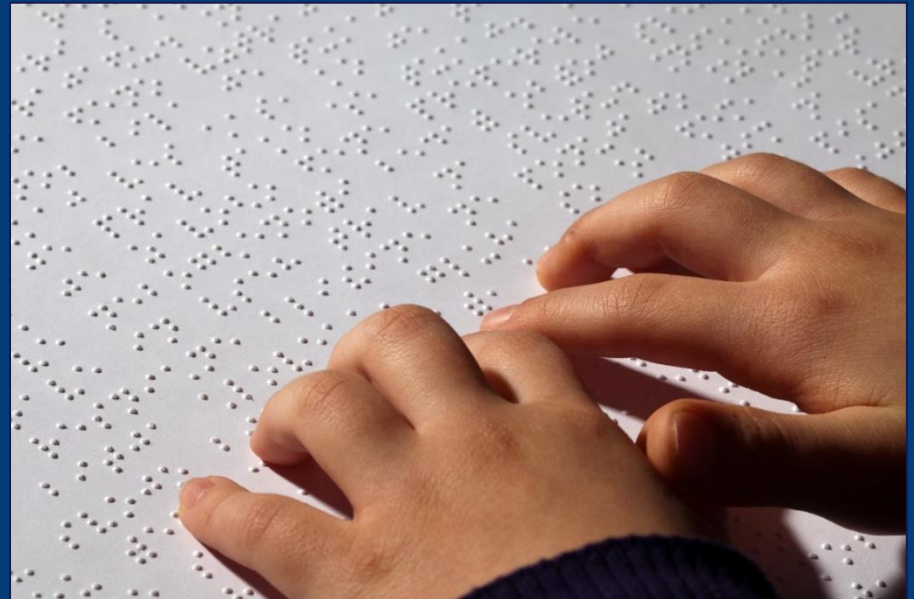
Man sieht nur mit dem Herzen gut. Das Wesentliche ist für die Augen unsichtbar. (Antoine de Saint-Exupéry)