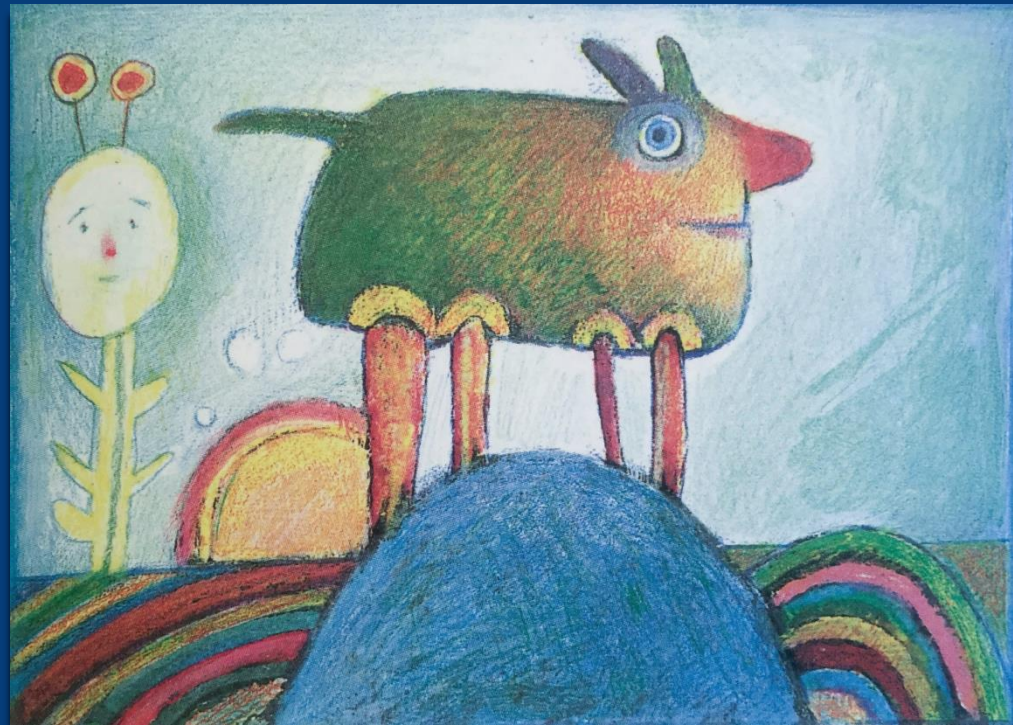
Eigentlich bin ich ganz anders, aber ich komme so selten dazu. (Odön von Horvath)