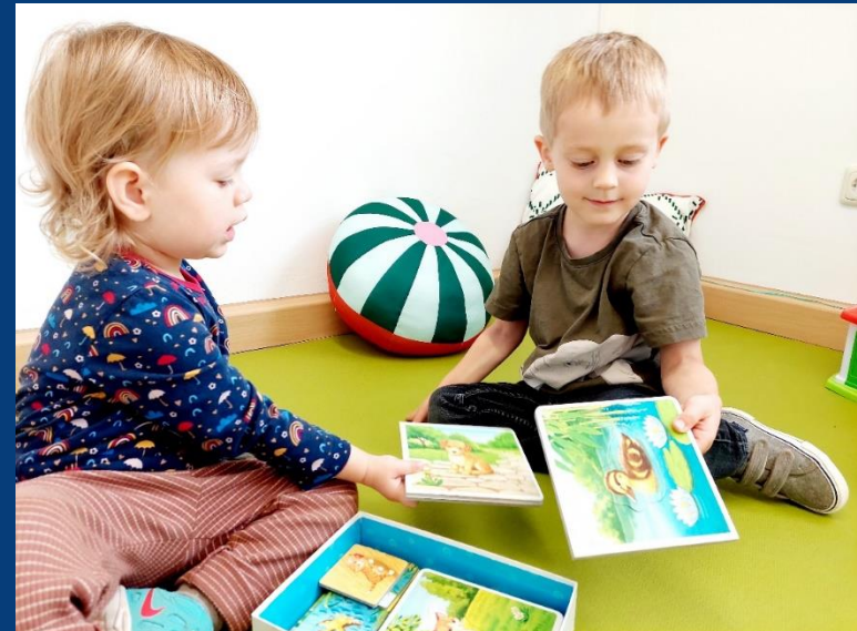
Die Grenzen meiner Sprache bedeuten die Grenzen meiner Welt. (Ludwig Wittgenstein)